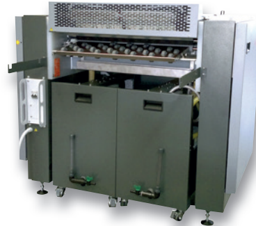
RECYCLERS ON WHEELS