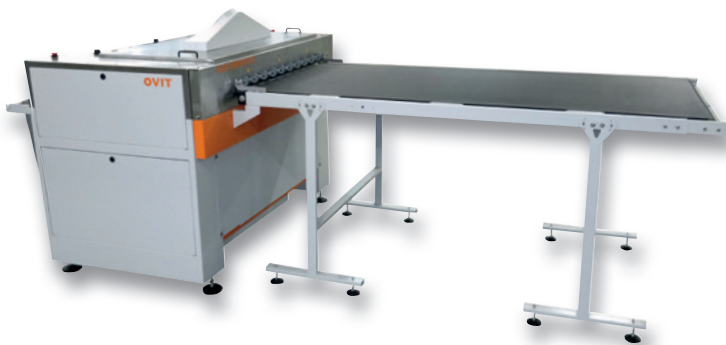
OPTIONAL: LGF INLET MOTORIZED CONVEYOR AND ST SLOPING OUTLET TABLE

Sehr stabil und umweltfreundlich • Gefertigt aus Edelstahl • Entworfen für einfache und schnelle Wartung • Reinigung aller Druckfarben über rotierende und changierende Bürsten: zwei oder drei Abhängigkeit von den Formen • Erhebliche Zeitersparnis in Übereinstimmung mit den Sicherheitsvorschriften für Personal und Umwelt durch Automatisierung des Reinigungsprozesses der Flexo-Druckplatten • Heiz- und Filtersystem für den Reiniger für zusätzliche Reinigungswirkung sowie erhöhte Chemiestandzeit • Geschlossener Kreislauf zur Filtrierung des Spülwassers für weniger Verschmutzung und Wassereinsparung • Alle Parameter sind über ein digitales Kontrollpanel verstellbar • Einlaufstisch und Auslauf-Aufnahmekorb • Optional: motorisierte Einlauf-Fördervorrichtung LGF sowie schräger Auslaufstisch ST • Auch als "S" Version für den Einsatz mit einem Lösungsmittel